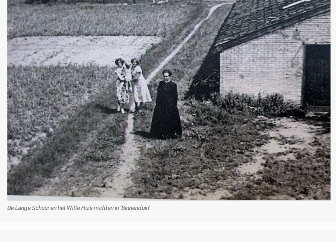
De Lange Schuur en het Witte Huis midden in 'Binnenduin'