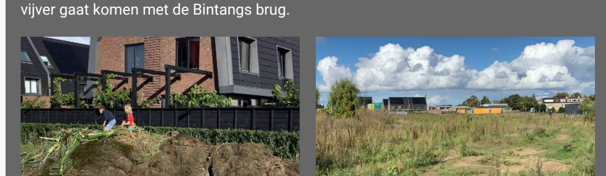
Spelen op groen uit de graafput

De vorige editie dateert alweer van eind vorig jaar. Gebeurt er dan zo weinig in Binnenduin? Nee hoor, er gebeurt juist hartstikke veel! Het begint nu eindelijk op een echte nieuwe wijk te lijken. Was het een jaar geleden nog hier en daar een woning, nu is het meer hier en daar een lege kavel. De Kennemerlandrecht waar men aan beide kanten kavels kon kopen, ligt nu al een echte bewoonde straat. Natuurlijk wordt er nog aan veel huizen getimmerd. Maandagochtend komen er meer 'bouwakkers' Binnenduin binnen dan dat er bezig zijn in de rest van Beverwijk, licht het. Het staat er helemaal vol met busjes van stukadoors, metselaars, timmerli, schilders, loodgieters, dakbedekkers, zonnepaneleninstallateurs en hoveniers. Grappig om te zien dat de ene tuin al helemaal klaar is voor de bewoners er zelf wonen en dat de ander gewoon de natuur zijn gang laat gaan. En dat gaat in Binnenduin erg snel. Je kan zien dat het vruchtbare tuindersgrond is (gewest). Afgegraven grond heeft heel snel een groene kleur. Het enige grote stuk waar het 'onkruid' nog welig tiert is de plek waar de grote vijver gaat komen met de Birtangs brug.